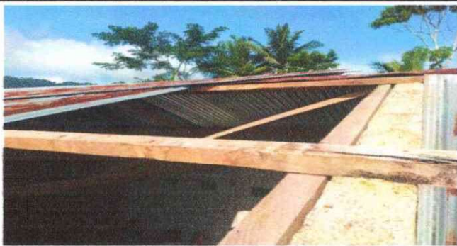
SUSTITUCIÓN DE TECHO FOTO 3