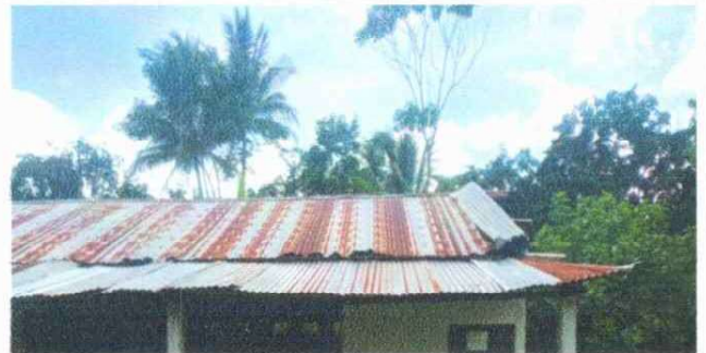
SUSTITUCIÓN DE TECHO FOTO 4