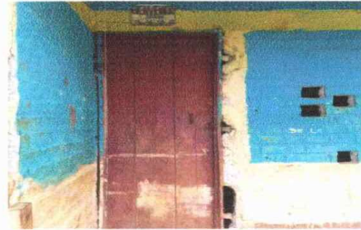
REMOZAMIENTO DE AULA FOTO 2