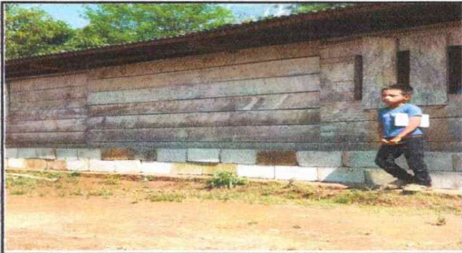
REMOZAMIENTO DE AULA FOTO 1